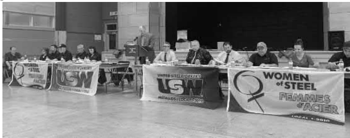
Membres du Conseil Exécutif de la Section Locale 1-2010