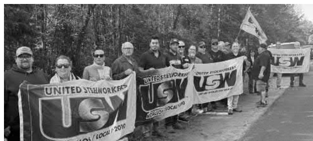
Nous avons pris le temps d'aller supporter les membres d'OPSEU qui sont en grève au Confédération College.